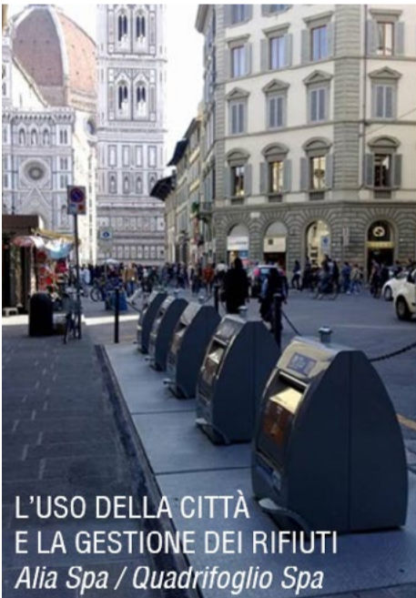
L'USO DELLA CITTÀ E LA GESTIONE DEI RIFIUTI Alia Spa / Quadrifoglio Spa