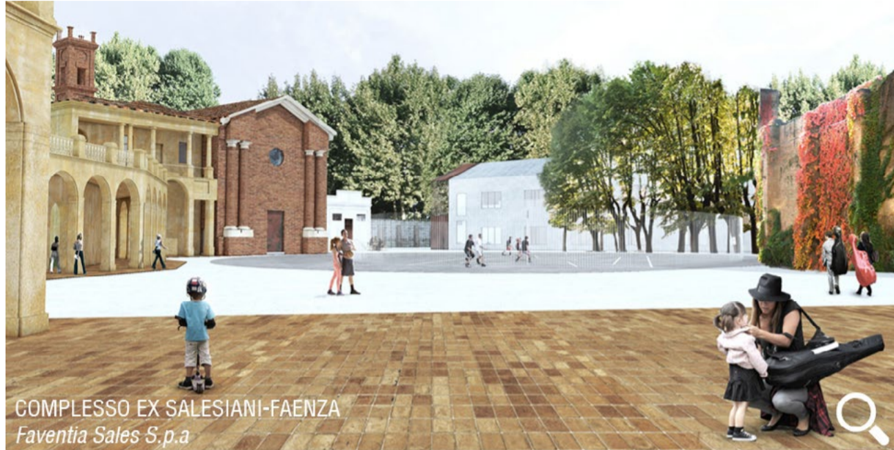
COMPLESSO EX SALESIANI-FAENZA Faventia Sales S.p.a

Infrastrutture e nodi urbani nel Progetto Paese: QVQC una sperimentazione di sistema