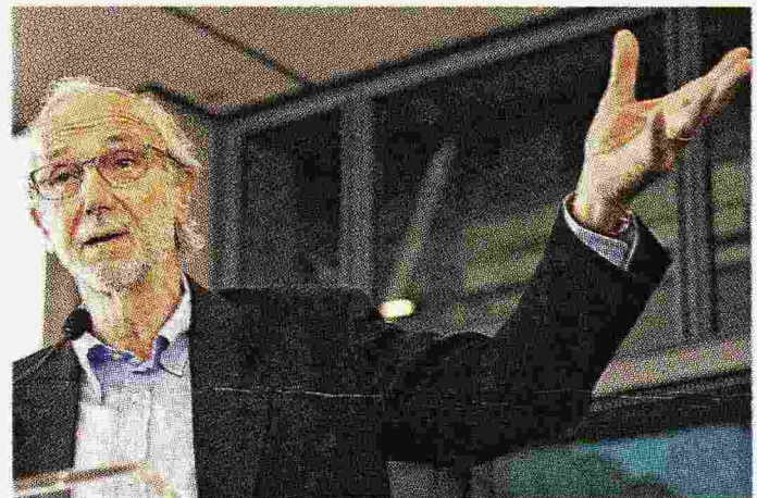
Renzo Piano, architetto e senatore a vita