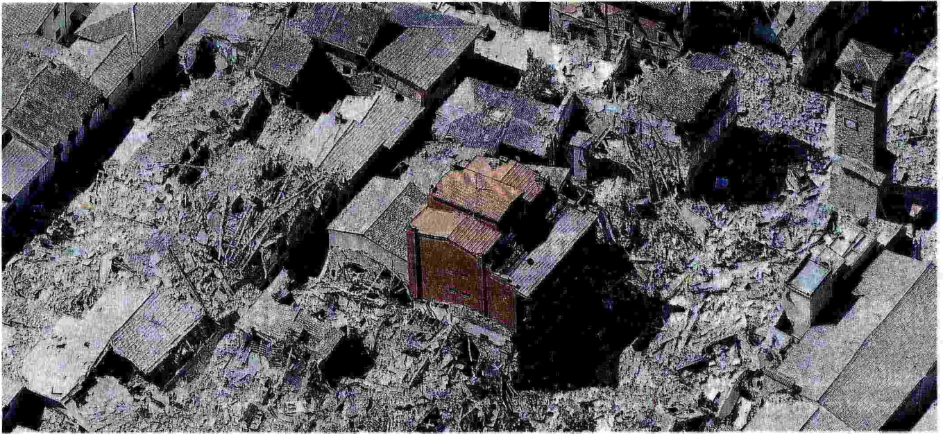
Rasa al suolo. La città di Amatrice vista dall'alto. I soccorritori sono al lavoro tra gli edifici crollati