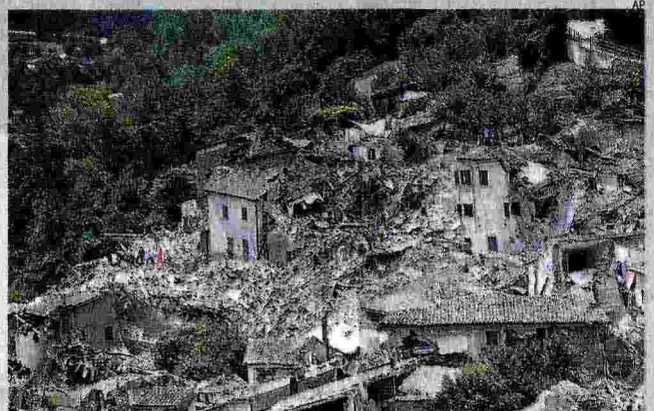
Devastazione. Pescara del Tronto: pochi edifici hanno resistito al sisma