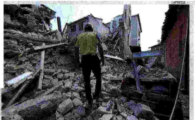
Distruzione. Un soccorritore tra le case sventrate di Accumoli

Prevenzione e soccorsi. L'Italia è considerato un modello nel mondo per l'organizzazione dei soccorsi incardinati sulla Protezione civile, volontari e forze di polizia coordinati da una struttura che dipende direttamente dal Governo. Molto carente, invece, la prevenzione. Il territorio, in gran parte sismico e attraversato da faglie, è anche sottoposto a grave rischio idrogeologico. Sarebbe necessario un piano di prevenzione straordinaria da 80 miliardi di euro in venti anni divisi tra opere antisismiche e idrogeologiche