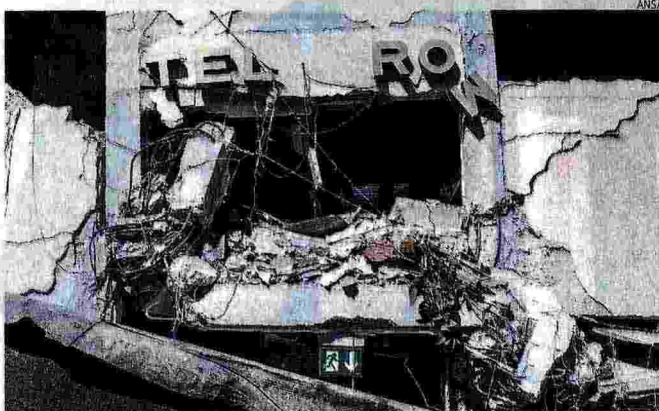
Crolli diffusi. L'ingresso dell'hotel Roma ad Amatrice