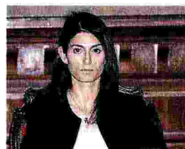
Virginia Raggi Le risorse per Roma

«Semplificazione decisiva per Fs-Rfi: risorse messe subito a disposizione, non serviranno due anni per l'ok al contratto»