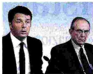
Matteo Renzi e Pier Carlo Padoan Le decisioni del Cipe

«Mercoledì scorso è stato un D-Day degli investimenti con la nuova programmazione Fsc: si capirà con il tempo quanto sia stato importante»