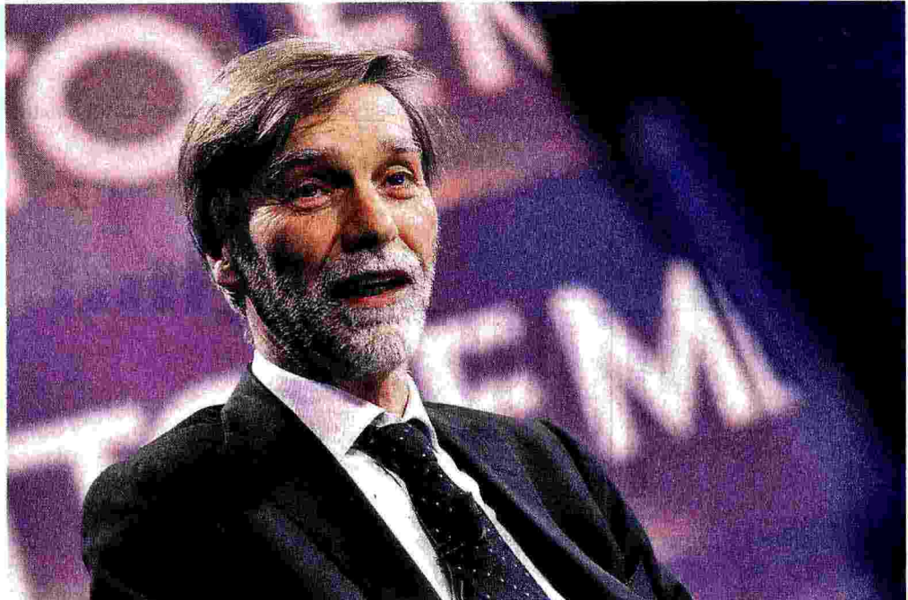
Ministro delle Infrastrutture Graziano Delrio

«Un miliardo alla Rolling Stock Company con Cdp per comprare bus e treni alle città»