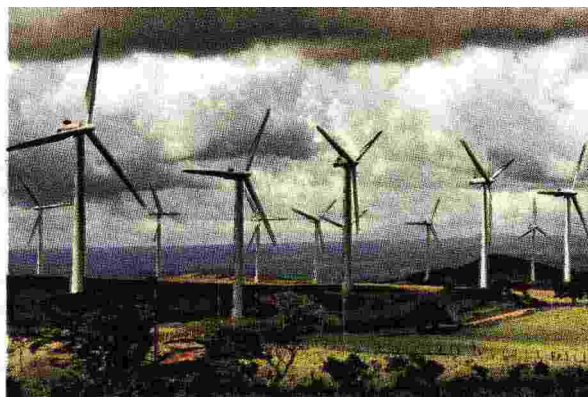
Se decidesse di produrre in maniera più efficiente, al 2030 il nostro Paese potrebbe disporre di 7,9 GW di potenza eolica in più