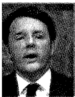
Il premier Matteo Renzi

l'occupazione. In pochi mesi partono 650 cantieri, vengono consegnati 2.800 appartamenti a settimana. Alla fine dei primi sette anni del piano sono stati costruiti 735 mila vani per un valore di 334 miliardi di lire. Alla scadenza del quattordicesimo anno i vani sono 2 milioni e l'incremento dell'occupazione di 41 mila lavoratori all'anno. Non altrettanto felici furono gli anni successivi con la Gescal, con investimenti dello Stato e trattenute su datori di lavoro e lavoratori. Al piano Fanfani lavorarono architetti,