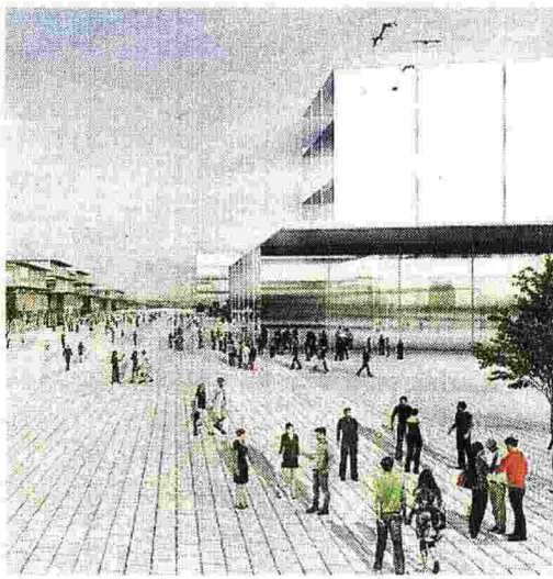
Come sarà Il rendering del progetto sulle aree ex Expo