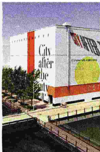
L'area ex Expo da poco riaperta

PRESIDENTE CRUI Gaetano Manfredi, rettore dell'università Federico II di Napoli Sopra due scorcii attuali dell'ex area Expo