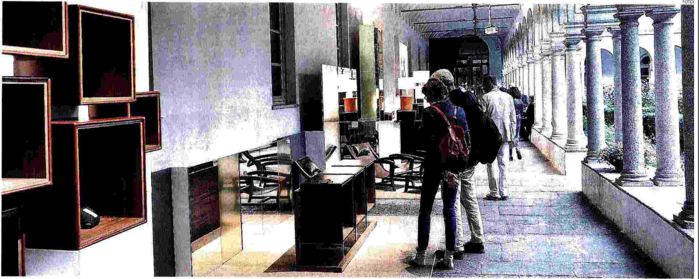
Chiosso di San Simpliciano. Le cinquanta sedie Manga di Nendo realizzate in collaborazione con la Friedman Benda Gallery di New York