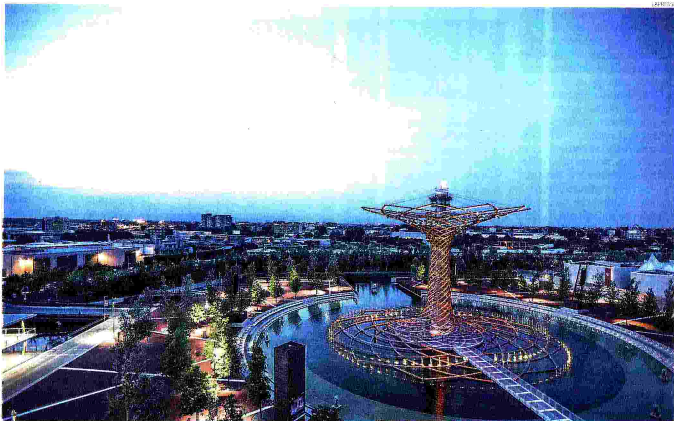
Hub dell'innovazione. L'area ex Expo è il luogo candidato a ospitare le sedi delle agenzie europee e le multinazionali