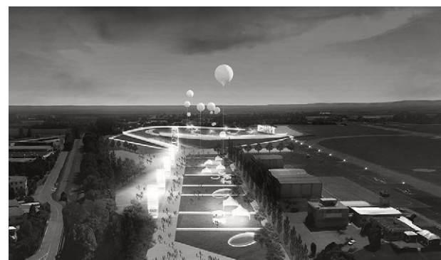
Arena eventi Campovolo