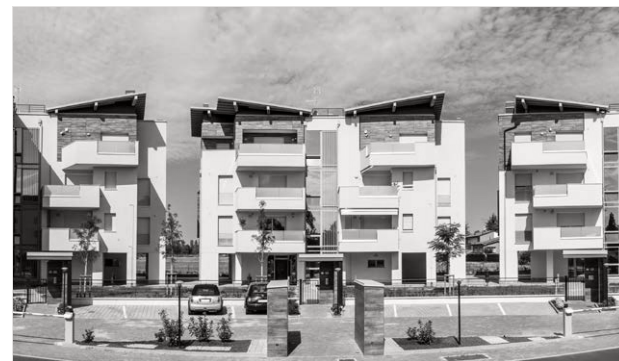
Investire in efficienza energetica per valorizzare il comfort domestico - Il caso Abitacoop- CasaClima