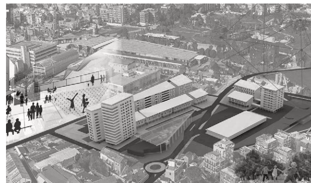
T3T Rigenerazione analogica 4.0