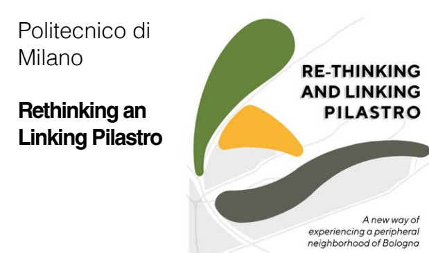
Politecnico di Milano Rethinking an Linking Pilastro