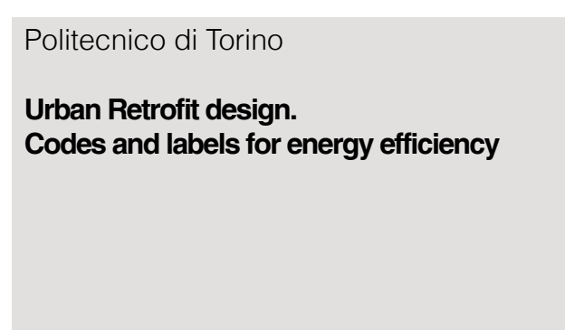
Politecnico di Torino Urban Retrofit design. Codes and labels for energy efficiency