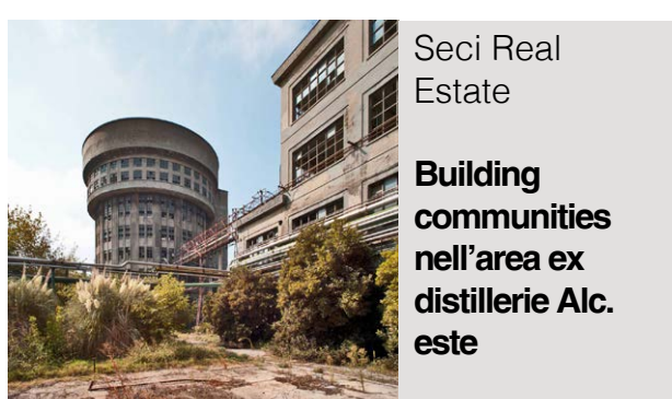
Seci Real Estate Building communities nell'area ex distillerie Alc. este