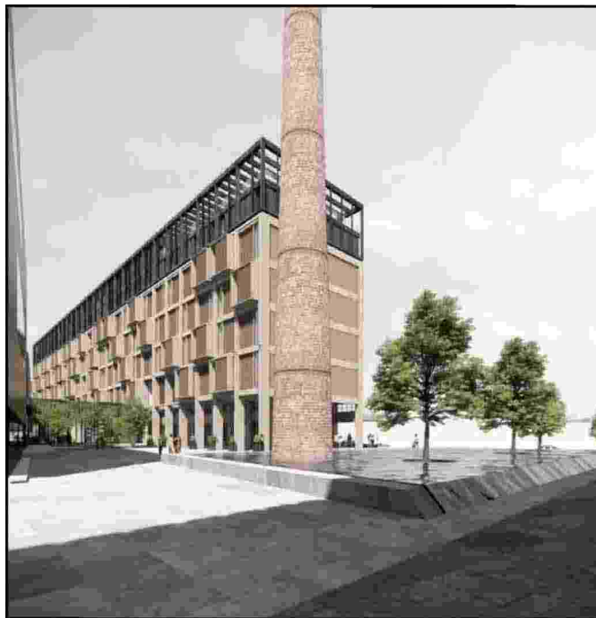
I rendering del recupero dell'ex Manifattura Tabacchi e la Piazza della Ciminiera

Verona sarà presente alla vetrina nazionale di Urbanpromo 2020 con il progetto dell'ex Manifattura Tabacchi. La 17a edizione, dal titolo "Progetti per il Paese" si svolgerà alla Triennale di Milano e vedrà la città scaligera protagonista nella mattinata del 19 novembre, con un evento in video-conferenza sulla piattaforma ZOOM.